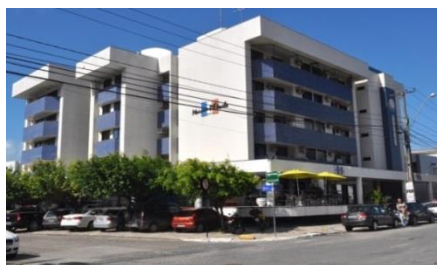
EDF. MAISON D'ETOILLE- AV. NEGO, 96-Tambaú